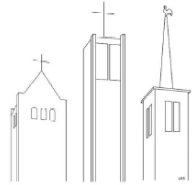
St. Kunigunde St. Thomas Morus St. Bartholomäus